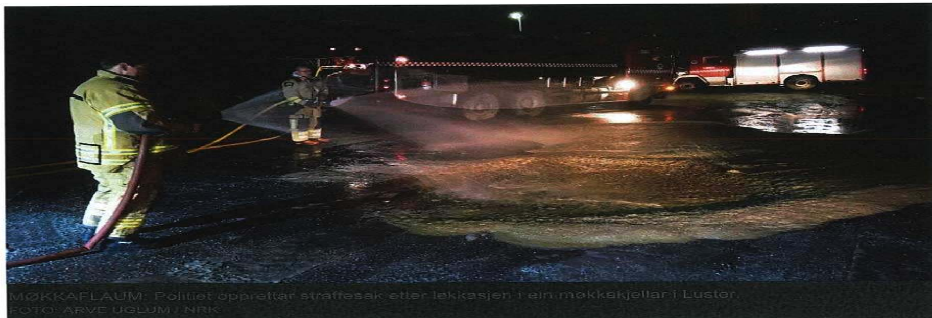
MØKKAFLAUM: Politiet opprettar straffesak etter lekkasjen i ein møkkakjellar i Luster.

Fleire hundre abonnentar knytt til Dale vassverk i bygda Luster må koke vatnet sitt etter at drikkevandet vart forureina av lekkasjen i ein møkkakjellar torsdag kveld.